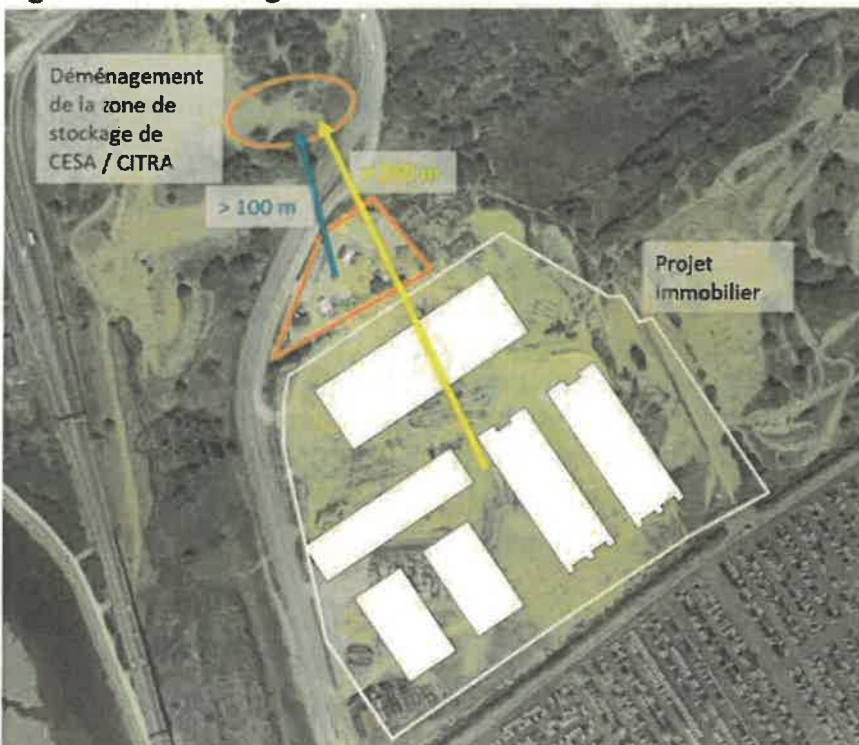
Figure 1 : Déménagement de l'activité de CESA / CITRA

Par ailleurs, dans un bulletin consacré à l'exposition à la silice, publié par le Ministère du travail de l'emploi et de l'insertion en juillet 2021, la liste des « situations professionnelles générant de la poussière en suspension dans l'air et qui contient une proportion de silice cristalline alvéolaire potentiellement dangereuse pour la santé » est dressée.